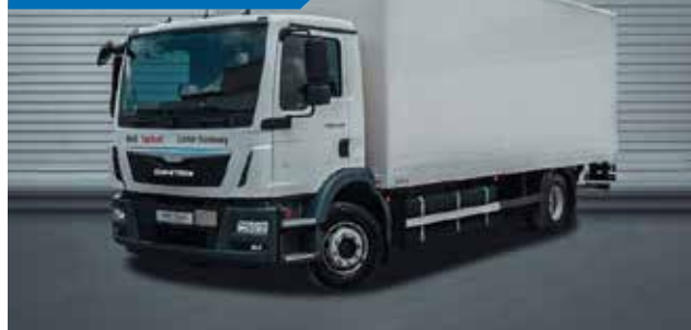
MAN TGM 15.XXX 4X2 BS - SKRZYŃNIA ZAMKNIĘTA + WINDA ZAŁADUNKOWA