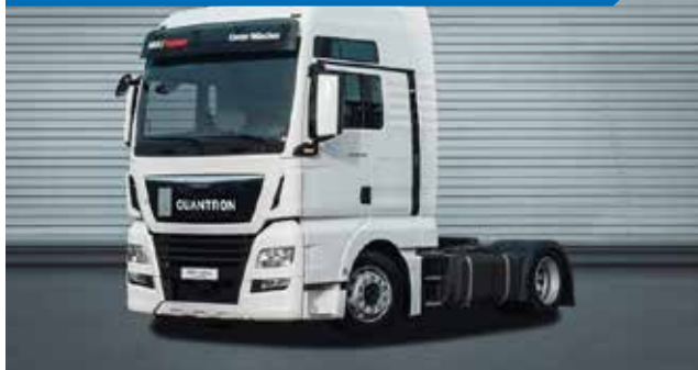
MAN TGX 18.XXX 4X2 BLS - SZM - CIĄGNIK SIODŁOWY