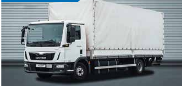
MAN TGL 12.XXX 4X2 BL - SKRZYŃNIA ZAMKNIĘTA + WINDA ZAŁADUNKOWA

⚡ 150-550 kW 📦 200 - 630 kWh 📍 do 500 km