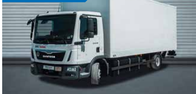
MAN TGL 12.XXX 4X2 BL - SKRZYŃNIA OTWARTA PLANDEKA + WINDA ZAŁADUNKOWA